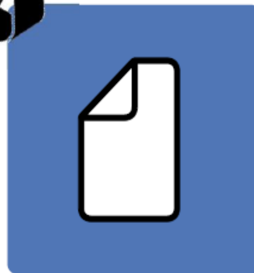
Papeles y cartones